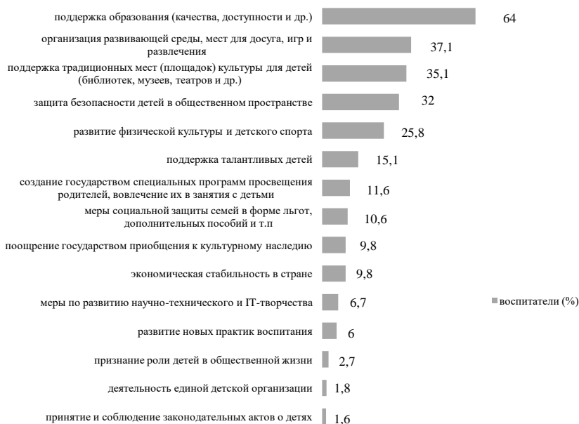
Рис. 1. Меры поддержки детства в современной России (в %)

Воспитатели считают важными и меры, связанные с организацией развивающей среды, мест для досуга, игр и развлечения (37,1%), поддержкой традиционных мест (площадок) культуры для детей (библиотек, музеев, театров и др.) (35,1%), защитой безопасности детей в общественном пространстве (32%). Эти меры отражают тенденции, которые наблюдаем в пространстве детства: увеличение роли потребительских практик детей, рост мобильностей и рисков детства. Возможно, данные меры, по мнению воспитателей, будут способствовать снижению негативных последствий этих тенденций и усилению позитивного отношения и доверие детей к окружающему их миру.